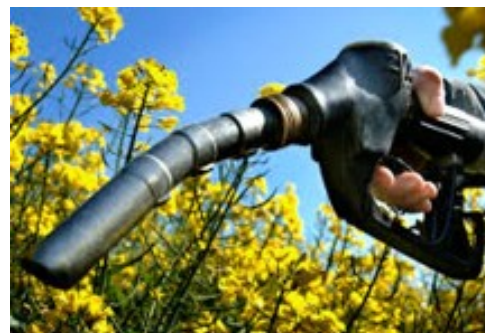
Biodízel – a környezetbarát üzemanyag